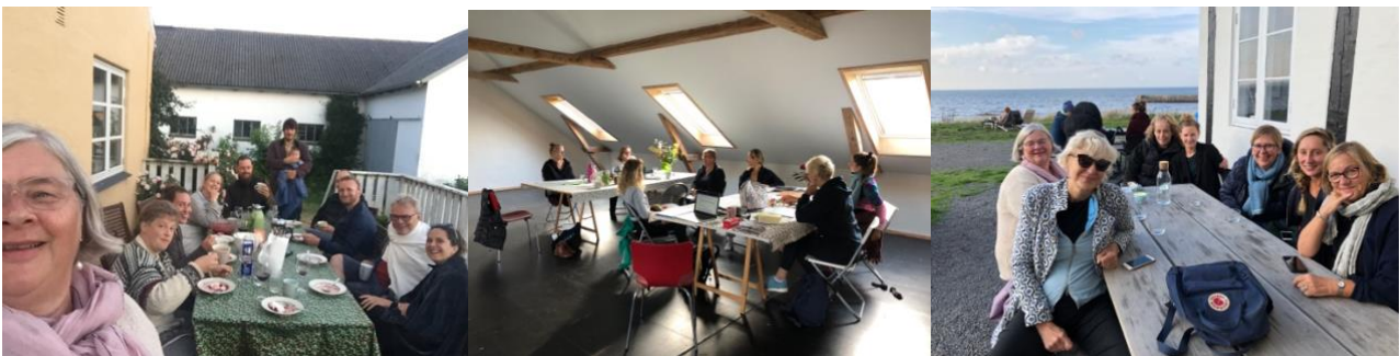
Artistic Entrepreneurship kursus: spisning, læring og ekskursioner