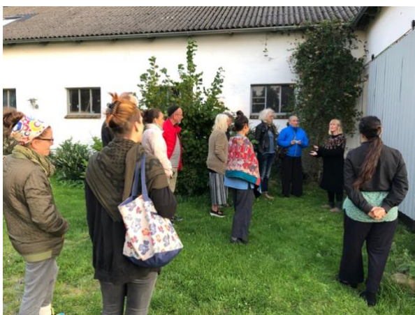
Anden visning 13/9 med MYKA/DK og Silvija & Maja/CZ

Andet Island Connect fandt sted 1-15/9, og der var åben visning 13/9 i regi af Bornholms Kulturuge – denne gang testede vi nye feedback processer fra Rivca Rubin af også med stor nytte for kunstnerne.