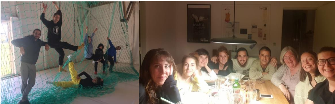
Første Island Connect med Aviaja Dance/DK og Migrants fra Mallorca/E